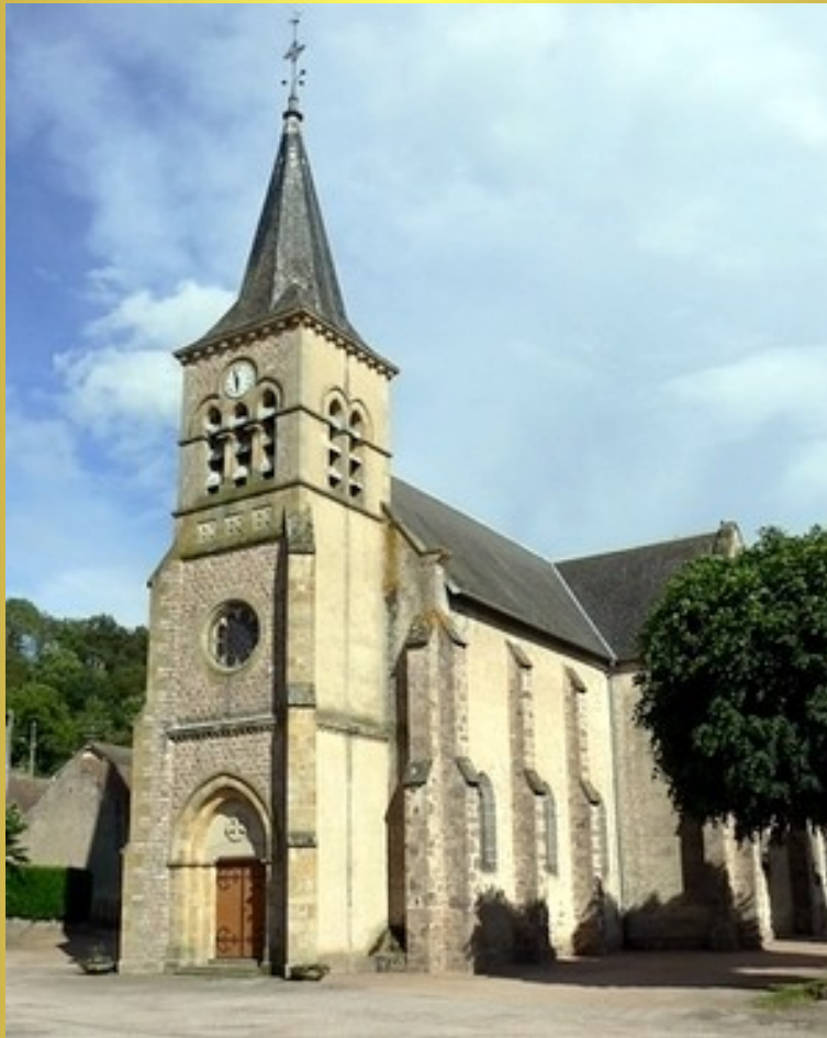
Église XIXe siècle

Jusqu'à la fin du XIXe siècle, il n'y avait pas d'église à Saint-Prix, pas plus qu'à Lapalisse, dont la paroisse se trouvait à Lubié. Cette église de style roman comprend une nef à trois travées. Ses contreforts sont très réduits, et il n'y a pas de bas-côté.